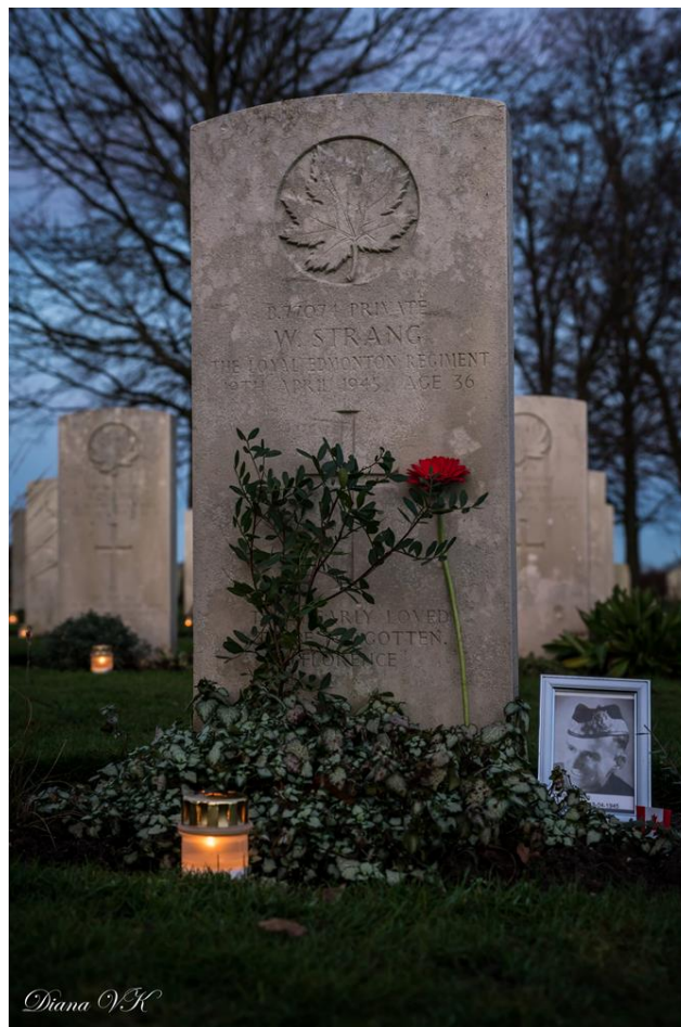
Lichtjesavond 24 december 2018.